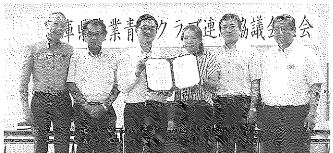
協定書を手にする小田垣会長(右から3人目)と新岡機構長(同4人目)